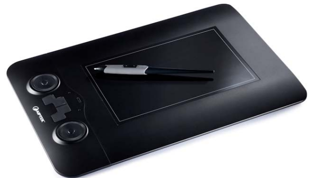
Art- Nr: 100065